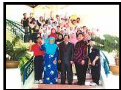
Untuk album... bergambar sebelum berpisah