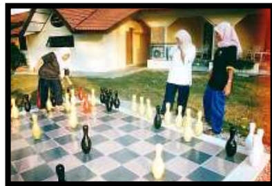
Beriadah... salah satu aktiviti yang diadakan