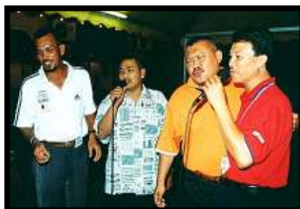
Tunjuk bakat... antara acara Majlis Makan Malam