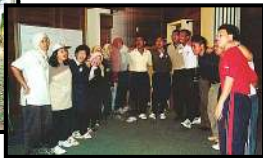
" Bila Diri Disayangi "merapatkan ukhwah antara peserta