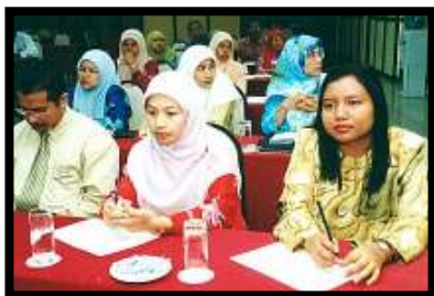
Ahli Pasukan Pelan Integriti PKNP turut hadir sesi ceramah