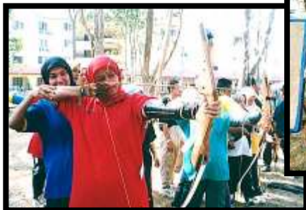
Aktiviti memanah..... membina kekuatan dalaman