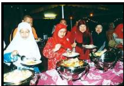
Menjamu selera... peserta-peserta kursus sedang menikmati hidangan yang disediakan