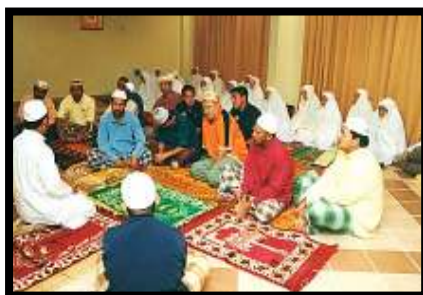
Beri tumpuan ... tazkirah selepas solat berjemaah