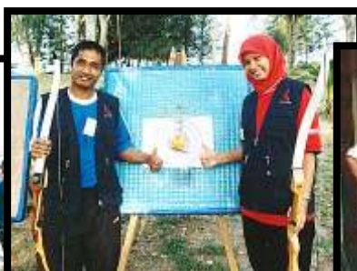
" Best of the best " aktiviti memanah