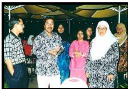
Ketua Eksekutif PKNP turut hadir di majlis makan malam bersama peserta kursus