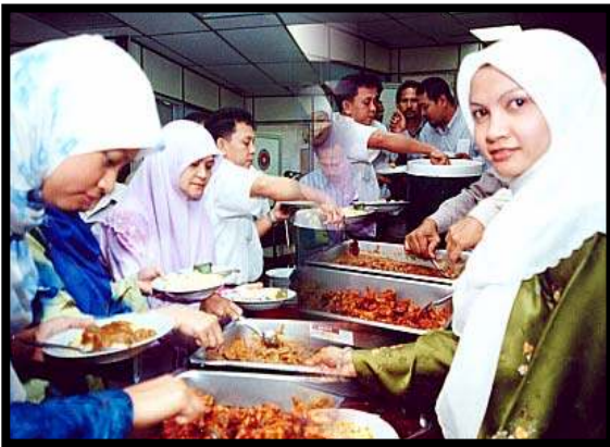
Anggota pekerja menjamu selera