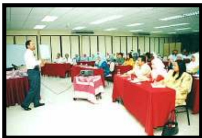
Ceramah Pelan Integriti Nasional.... disampaikan oleh Timbalan Presiden Institut Integriti Malaysia