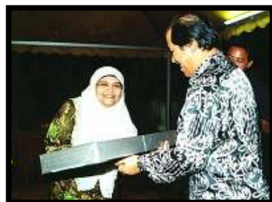
Tuah badan.... salah seorang peserta yang memenangi hadiah cabutan bertuah