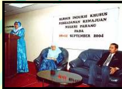
Pengerusi majlis sedang mengalu-alukan kehadiran peserta-peserta kursus