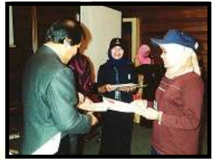
Ketua Eksekutif PKNP menyampaikan sijil kepada salah seorang peserta kursus