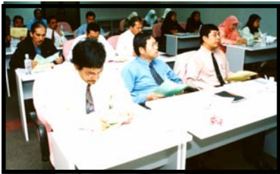
Sebahagian dari pegawai-pegawai PKNP yang menghadiri Seminar