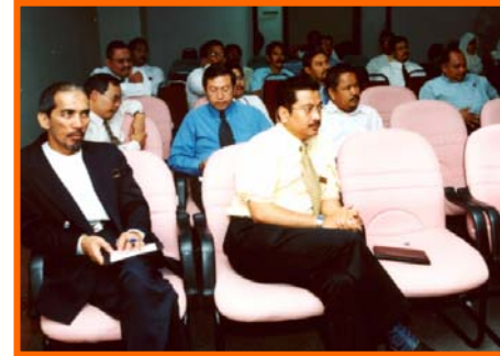
Sebahagian dari pegawai-pegawai PKNP yang hadir