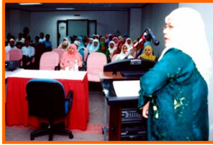
Pengurus Pentadbiran & Sumber Manusia sedang memberi taklimat

Majlis taklimat tersebut disusuli dengan perlantikan Ahli-Ahli Jawatankuasa Pekerja MBJ bagi semua peringkat kumpulan anggota pekerja PKNP.