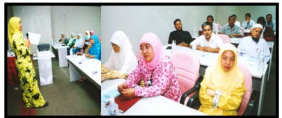
Peserta-peserta kursus sedang diberi taklimat