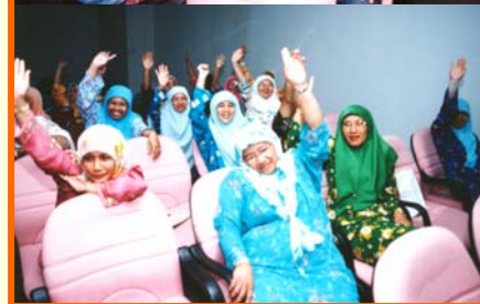
Pengundian sedang berlangsung