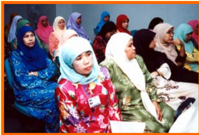
Penuh minat... sebahagian lagi para hadirin

Jawatankuasa Pekerja yang telah dilantik adalah seperti berikut :