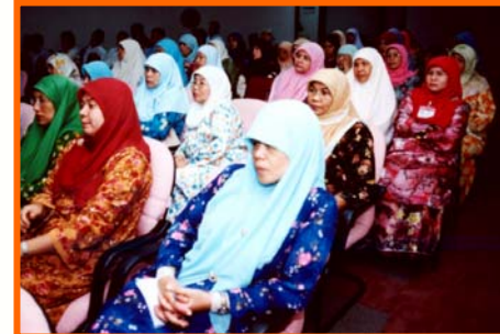
Beri tumpuan... hadirin sedang diberi penerangan

Jawatankuasa Pekerja di atas telah memilih 10 orang di kalangan mereka untuk mewakili 'Pihak Pekerja' seperti berikut :