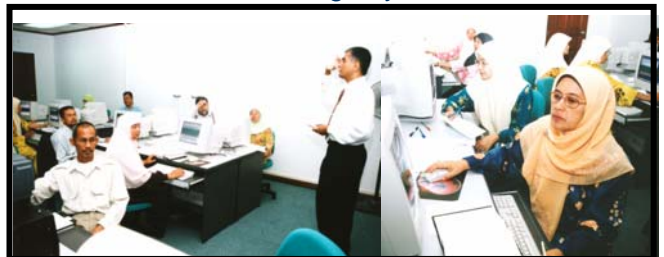
Peserta-peserta kursus sedang memberi tumpuan

Seramai 22 orang anggota pekerja Bahagian Kewangan yang berkaitan dengan sistem tersebut telah menghadiri kursus ini yang dikendalikan oleh penceramah daripada N. Selvam Consult, Petaling Jaya.